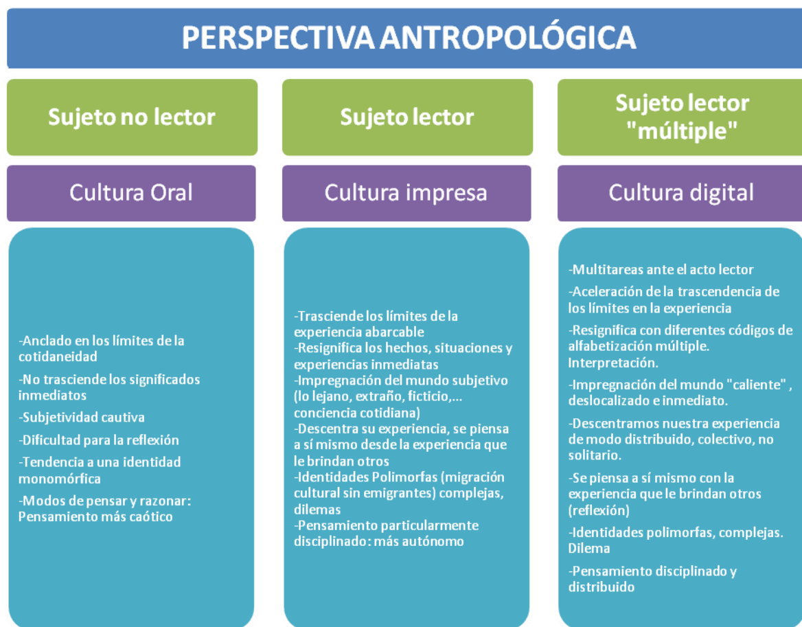
Figura 3. Elaborado a partir de Gimeno (2001) y Lankshear y Knobel (2008)

No obstante, poder acceder a estas nuevas experiencias lectoras a través de las tecnologías, o no hacerlo; tener, en definitiva, la oportunidad de aprender utilizando los nuevos sistemas de representación, o no tenerla, va a depender de la capacidad para leer en el sentido clásico del término. Y, por tanto, como luego veremos, de un contexto escolar en el que las nuevas formas de leer que nos brindan las tecnologías no anulen a las ya existentes, sino que las complementen y las refuercen.