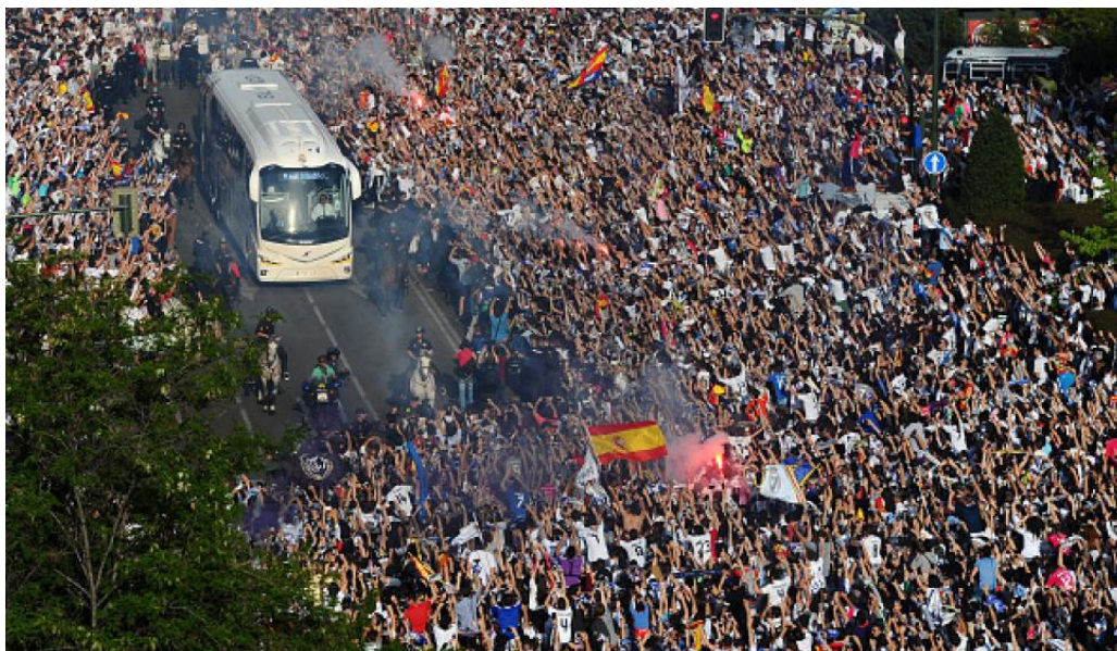
Figuras 3 y 4. En actualidad la Semana Santa es un producto mass mediático equiparable a otras manifestaciones culturales contemporáneas.

En un segundo nivel social, un gran número de estos sujetos individuales están interconectados entre sí, generando nuevas redes de conocimiento en los que cada uno se configura como uno de los nodos anteriormente mencionados. Estos, no sólo comparten intereses e inquietudes, sino que además se organizan en comunidades, cerradas o abiertas autosuficientes.